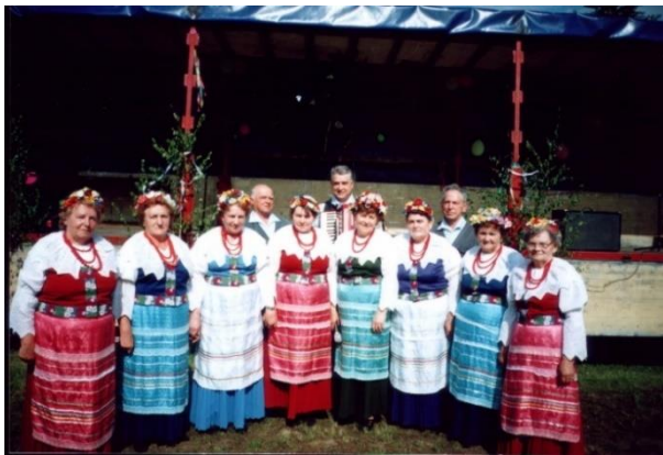
Zespół „Jutrzenka” przed występem z okazji „Dni Grodzca