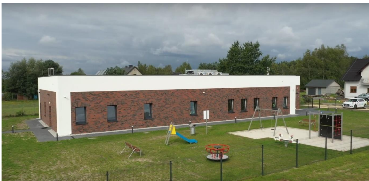
Budynek przedszkola w Grodzicu

Na terenie sołectwa funkcjonuje Zespół Szkolno-Przedszkolny im. Mikołaja Kopernika, gdzie uczęszczają także dzieci z sąsiednich sołectw Chobia i Mnichusa. Szkoła jest dobrze wyposażona w urządzenia dydaktyczne, oferuje zajęcia z języków obcych (angielski, niemiecki). W nowym, oddanym do użytku w 2022 r. budynku przedszkola mogą odbywać się zajęcia dwóch 25 osobowych grup.